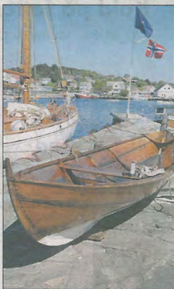
Denne 70 år gamle båten er kjent for mange brudepar, som er blitt fraktet på romantisk vis fra Melingsiden til bryllupsfest på Hummeren Hotel.