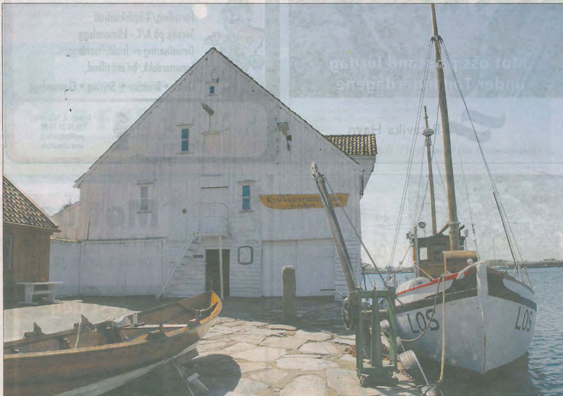
Kystkultursamlingen ligger i det gamle Melingsjøhuset fra 1851. Naustet er stappfullt av maritime minner.

En far og sønns private samling ble museet som formidler hele Tanangers maritime historie.