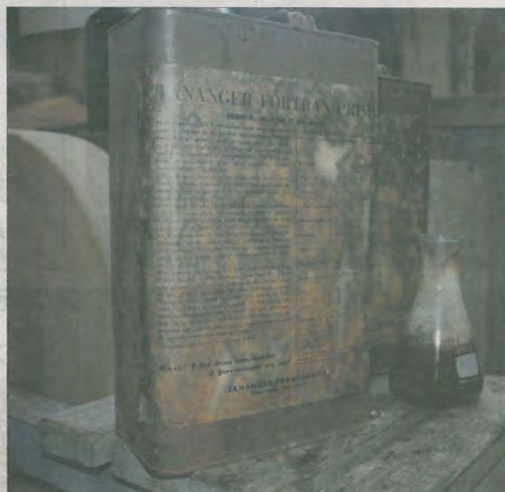
Grant Meling sin hjemmelagede tran.