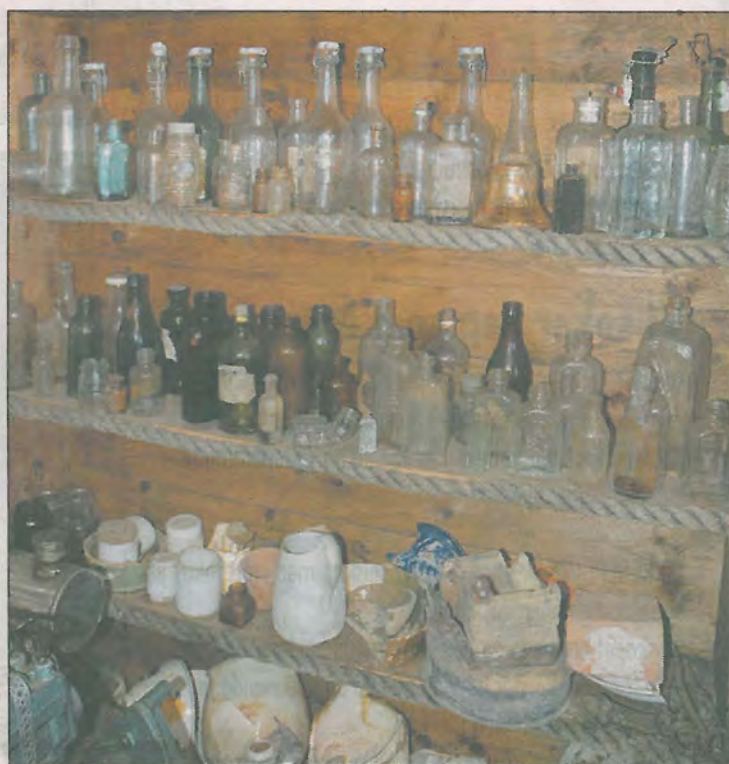
Noe av hva som er funnet i området rundt naustene på Melingsiden.