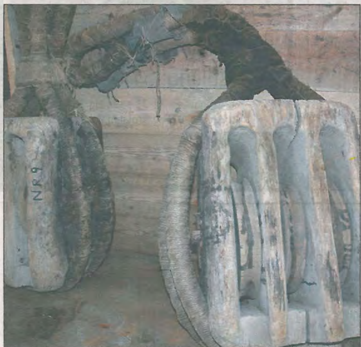
Talgjer som ble brukt til å trekke opp og sneu båter for vedlikehold.